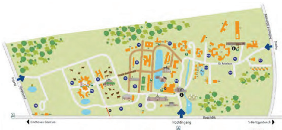
Plattegrond De Grote Beek.

oplossingen voor parkeren en transport worden bedacht. Op basis van de uitkomsten van de analyse zijn zes thematische lijnen uitgezet voor de toekomstige ontwikkeling: energie, water, biodiversiteit, arbeid, recreatie en ruimtelijke organisatie. De thematische lijnen gaan we uitwerken in vier ruimtelijke scenario's met verschillende invalshoeken: het perspectief van de cliënten, de opdrachtgevers, het personeel, de hoveniers, de ondernemers en bezoekers. →