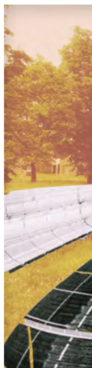
COLLAGES KORNELIA DIMITROVA