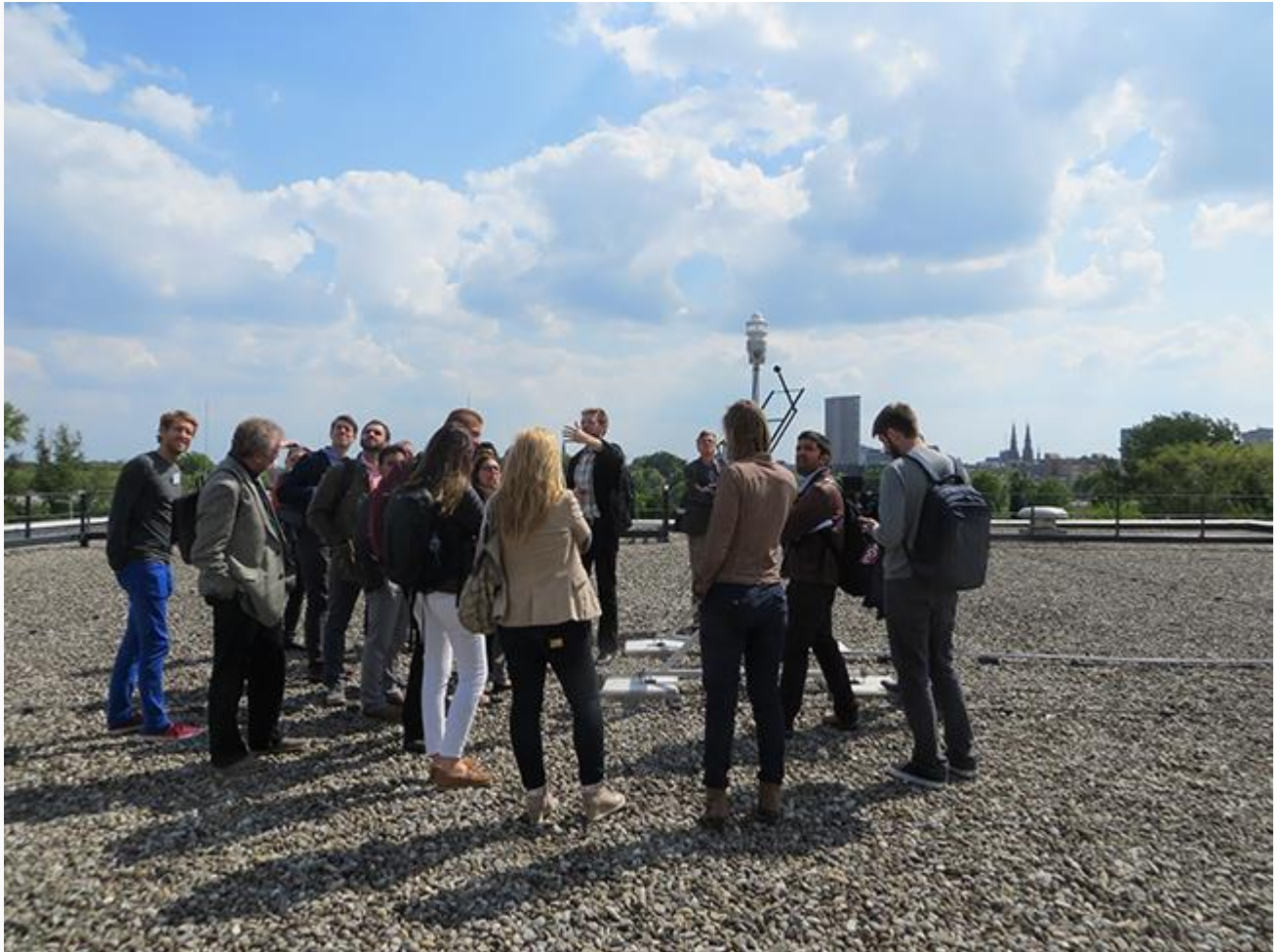
Abb.: Vorführung des Tageslichtmessplatzes auf dem Labordach.

»Global Open Lab Days« an der TU Eindhoven