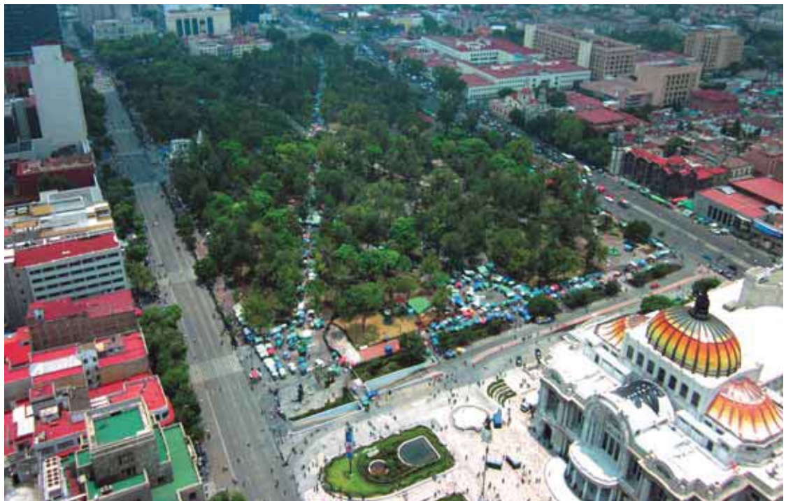
Alameda central y Palacio de Bellas Artes

Un segundo factor por el cual la conservación local puede encontrar dificultades es la organización a nivel administrativo. A pesar de la existencia de leyes de protección, la coordinación entre las diferentes autoridades locales puede representar un reto y entorpecer la optimización de los recursos que un bien puede ofrecer. En di-