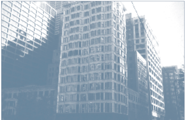
Reliance Building in Chicago

De gebouwen op deze foto dateren allemaal uit de jaren tachtig en negentig, ook niet erg opzienbarend. Maar er is een verschil: de gebouwen rondom het gebouw waar ik het over wil hebben zijn allemaal gebouwd in de twintigste eeuw, terwijl de wolkenkrabber op de voorgrond dateert uit 1893, dus uit de negentiende eeuw. Het is Reliance Building gelegen aan State Street, “that great street” zoals Frank Sinatra zong, het Broadway van Chicago.