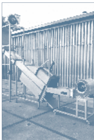
De IWA Fire Tester

Hierin zijn de elementen vlieg vuur, wind en straling opgenomen, zoals voorgeschreven in de Richtlijn Bouwproducten. Aangetoond is dat de methode een goede reproduceerbaarheid bezit. Dit voorstel had